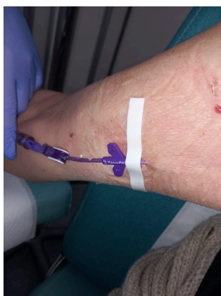
Figura 1. Tira estabilizadora en el recambio del PICC con tipo de fijación sin suturas Statlock .