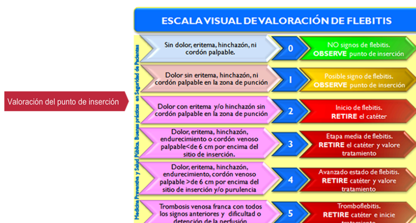
Figura 4. Escala Visual de Valoración de Flebitis

La escala Maddox gradúa la severidad de la flebitis en función de los signos presentes, su intensidad y extensión: