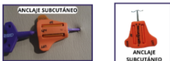
Figura 2. Fijación mediante anclaje subcutáneo.